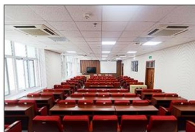
大型多功能报告厅 大型培训教室