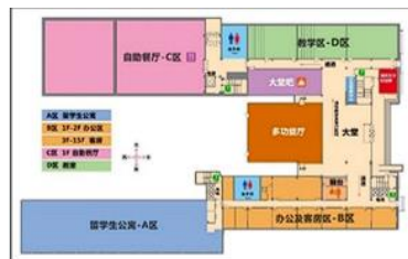
培训楼一楼大厅 培训楼一层平面图