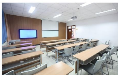
中型培训教室 小型培训教室