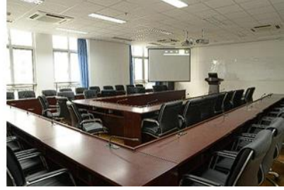
交互型智慧教室 U型会议室